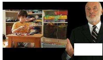
Selbstwahrnehmung: Bingo für Besserwisser