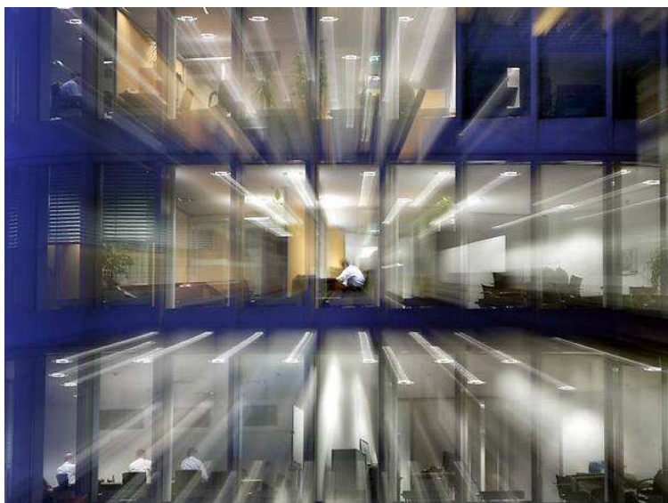
Druck, Stress, Ellenbogenmentalität: Die meisten Arbeitnehmer haben einen düsteren Blick auf die Berufswelt von heute.